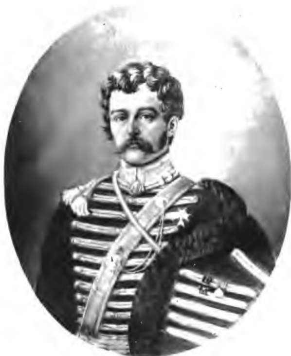
Сергій Васильевичъ Колычевъ (1791—1836).