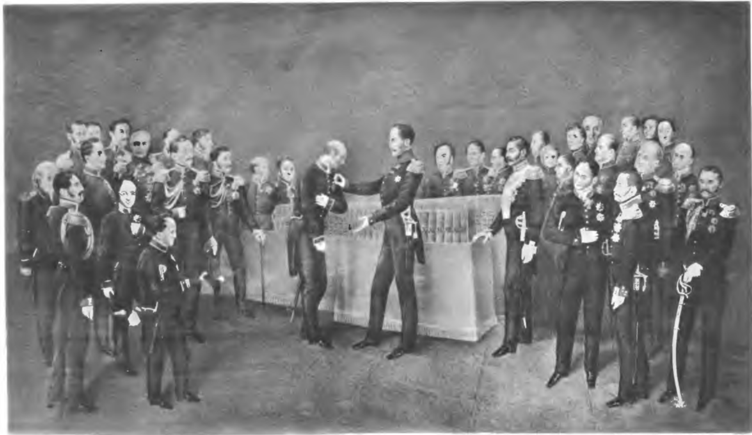
Императоръ Николай Павловичъ