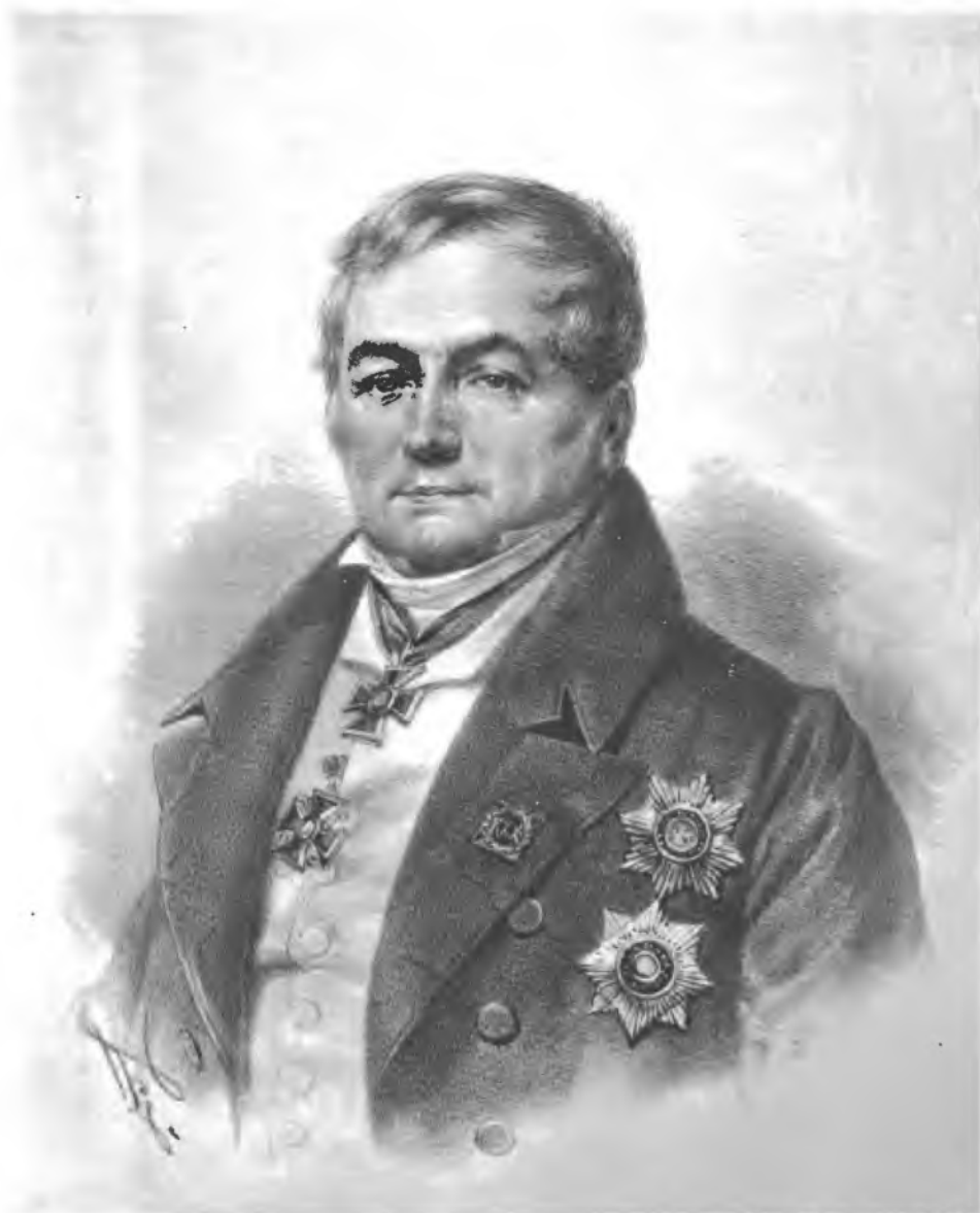
Фот. Гравюра Шереръ Наблюденья въ Москвѣ.