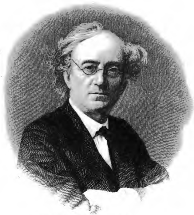
Печ со стали Ф.А.Брокгауза въ Лейпцигѣ.