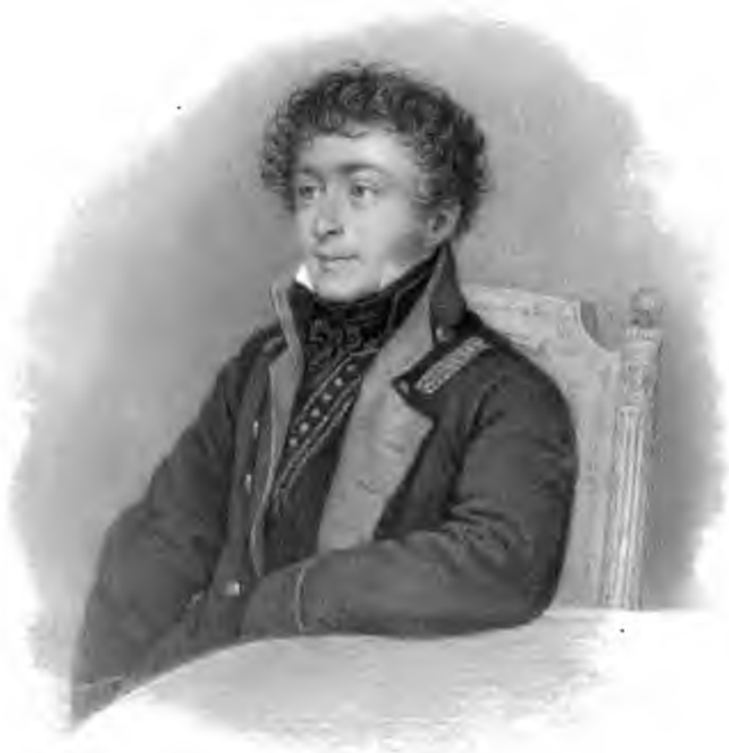
(1862) Рис. П. Смирновъ съ оригинала Кипренскаго. 1815.)